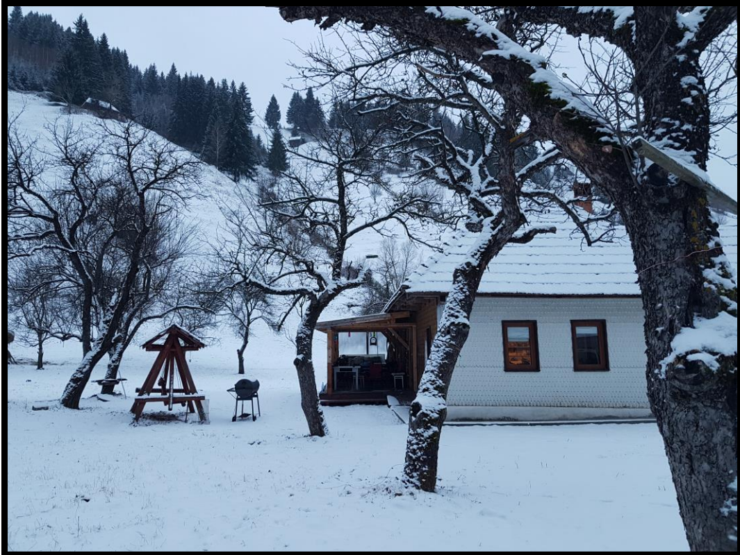
Le gîte où nous serons hébergés.